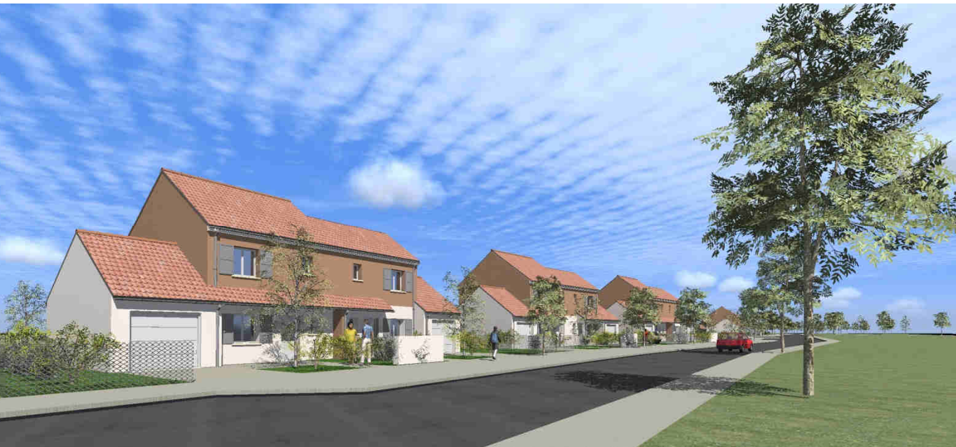
Vue – depuis la rue