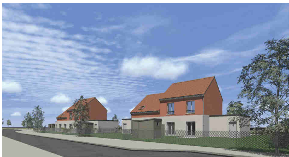
Vue – sur les jardins