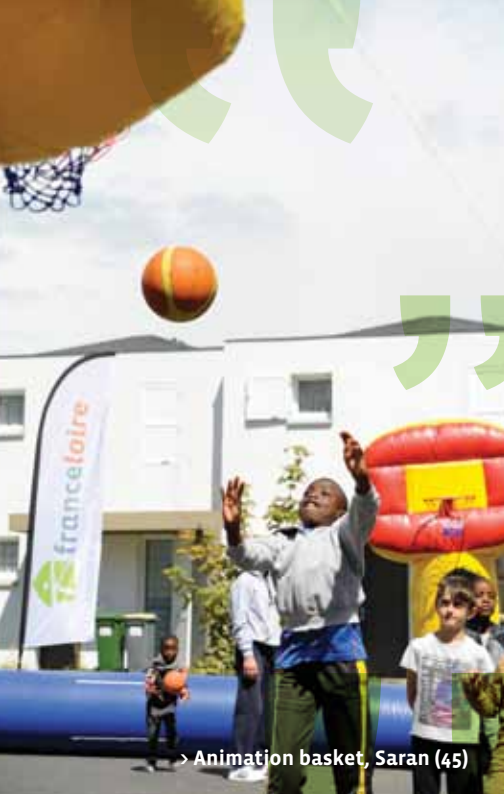
> Animation basket, Saran (45)