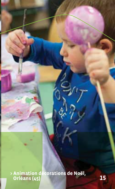
> Animation décorations de Noël, Orléans (45)