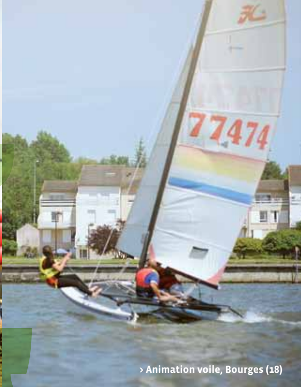
> Animation voile, Bourges (18)